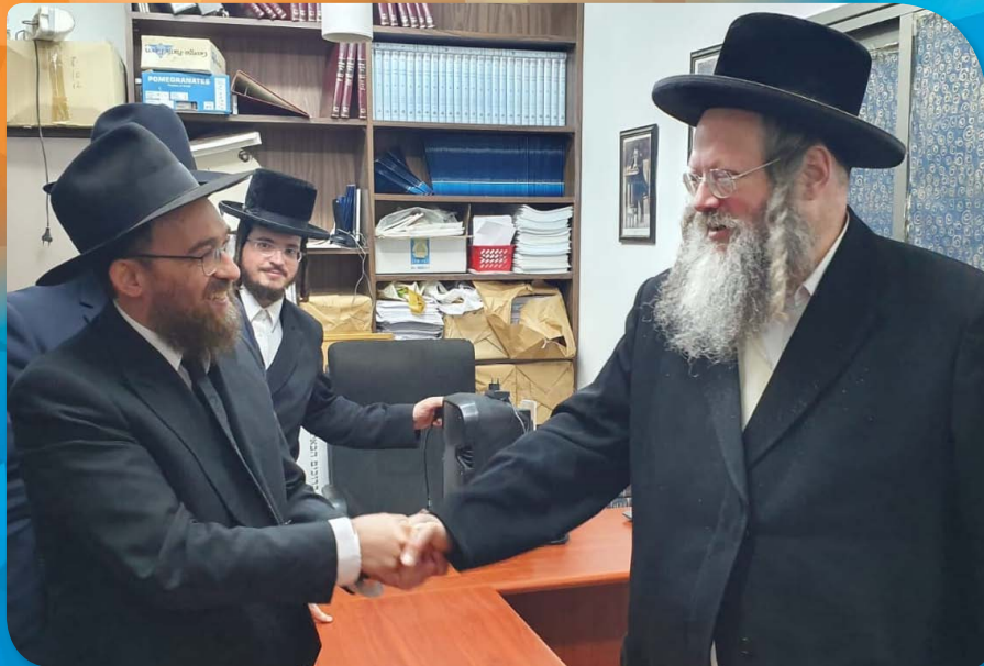
בפגישה עם הגאון הגדול הרב משה שאול קליין שליט"א