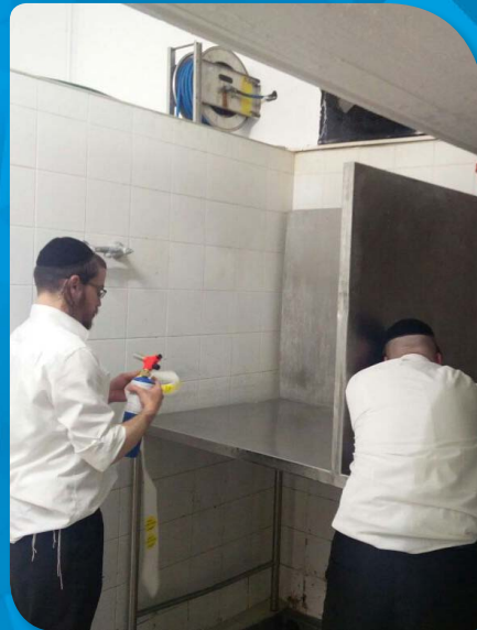
ההכשרה לפסח במרכז הרפואי העמק בעפולה