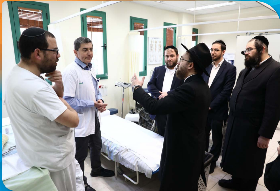
בסיוור במחוז ירושלים עם צוות קשרי לקוחות מזרד חרדי במחוז ירושלים