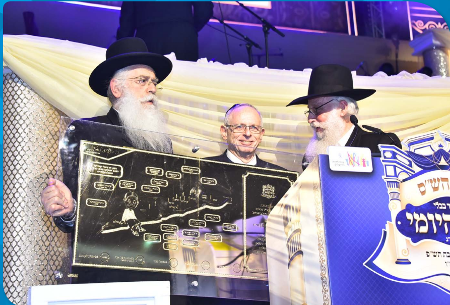
מנכ"ל כללית מקבל בסיום השי"ס המרכזי את הוקרה על פעילותו הרבה למען בריאות הציבור