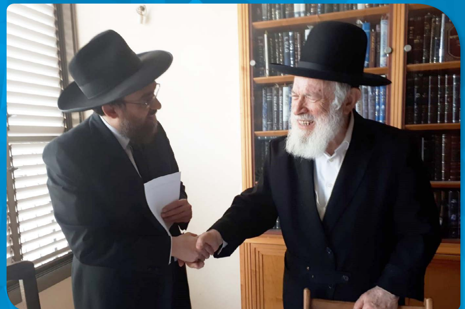
במעמד מכירת חמץ של חברות התרופות אצל הגאון הגדול הרב יצחק זלברשטיין שליט"א