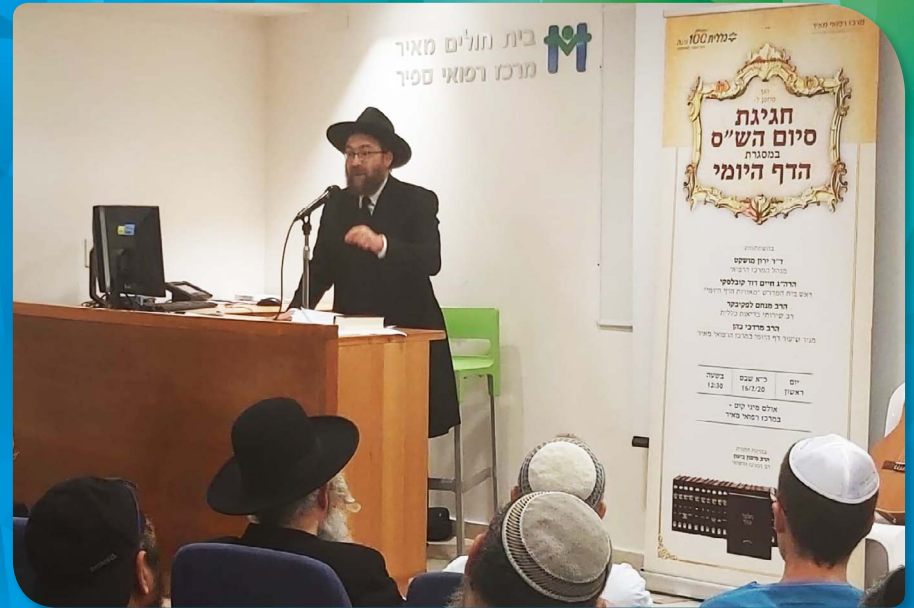
בחגיגת סיום הש"ס לרופאים ואנשי צוות במרכז הרפואי מאיר