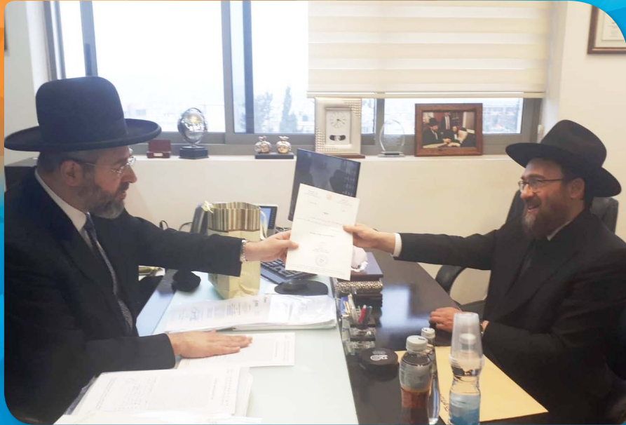
במכירת חמץ של שרותי בריאות כללית אצל מרן הרב הראשי לישראל הגאון הרב דוד לאו שליט"א