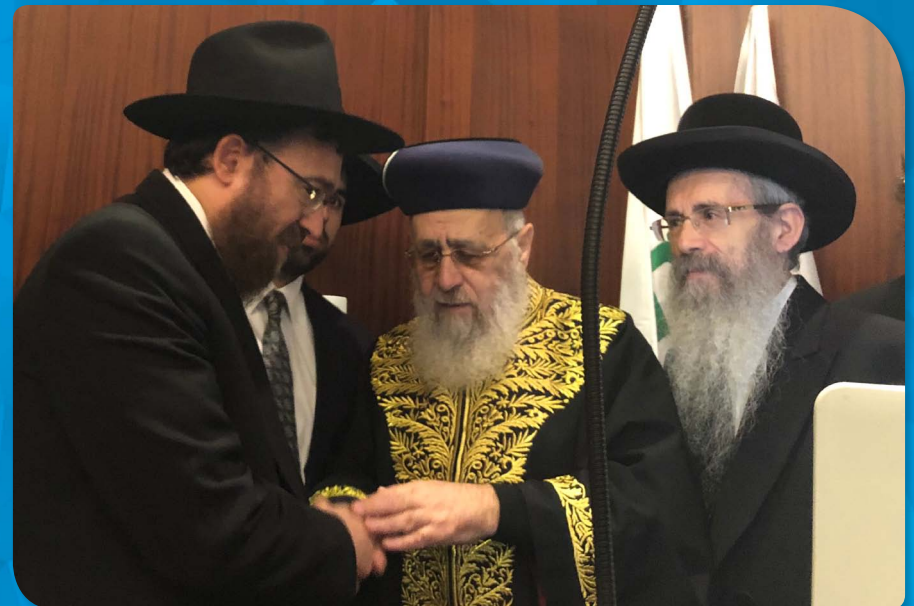
בביקור מרן הרב הראשי לישראל הראשון לציון הגאון הרב יצחק יוסף שליט"א במרכז הרפואי 'העמק' והרב ישעיהו הרצל - רב העיר נצרת עלית