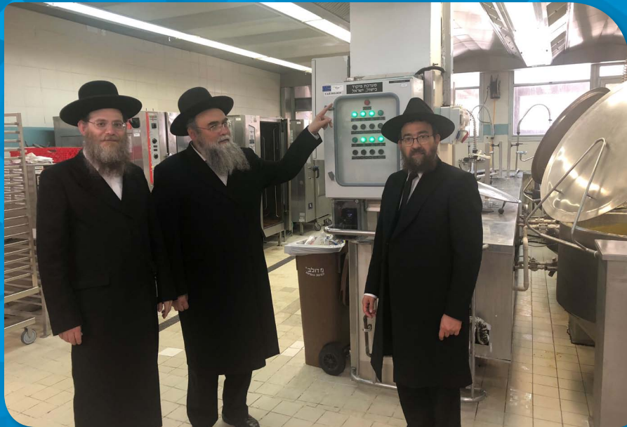
בסיוור כשרות וכחינת מערכת ביומטרית חדשנית "לבישול ישראל" במטבח המרכז הרפואי בילינסון עם הרב פנחס פרנקל רב משרד הבריאות והרב ישראל בבצ"ק רב המרכז הרפואי בילינסון