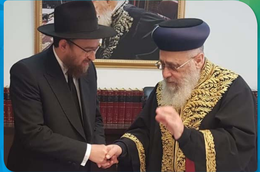
הרב מנחם לפקיבקר, רב שירותי בריאות כללית עם מרן הרב הראשי לישראל הראשון לציון הגאון הרב יצחק יוסף שליט"א