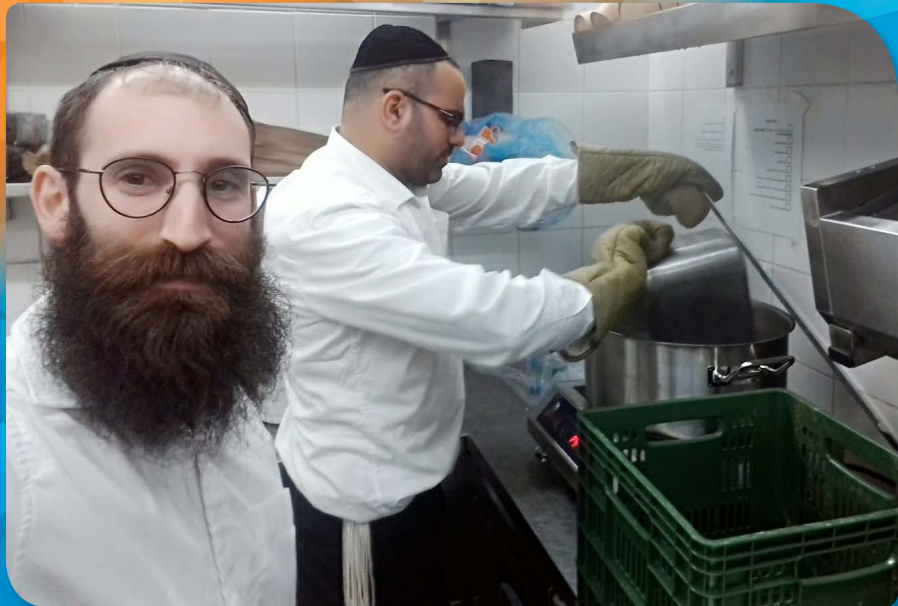
במבצע הכשרות לפסח במרכז הרפואי 'קפלן'