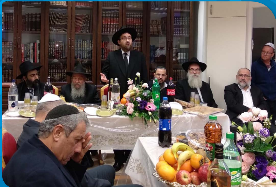
עם רב העיר אילת הרה"ג יוסף העכט שליט"א ורבני השכונות בבית הכנסת במרכז הרפואי יוספטלי באילת